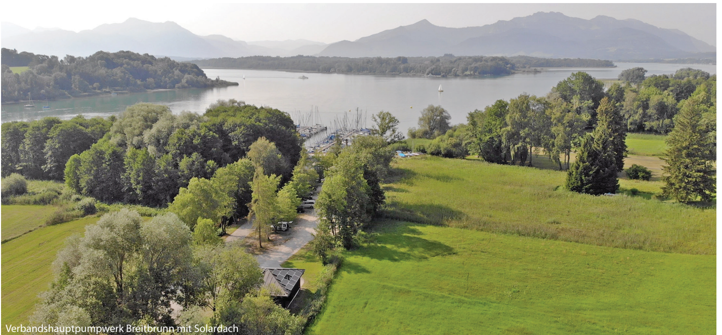
Verbandshauptpumpwerk Breitbrunn mit Solardach

Die gesamte Bevölkerung laden wir dazu herzlich ein.