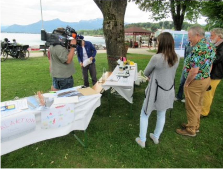
Regionalfernsehen Oberbayern (RFO) filmt die Aktion