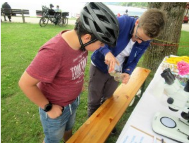
junger Besucher mit Wasserprobe