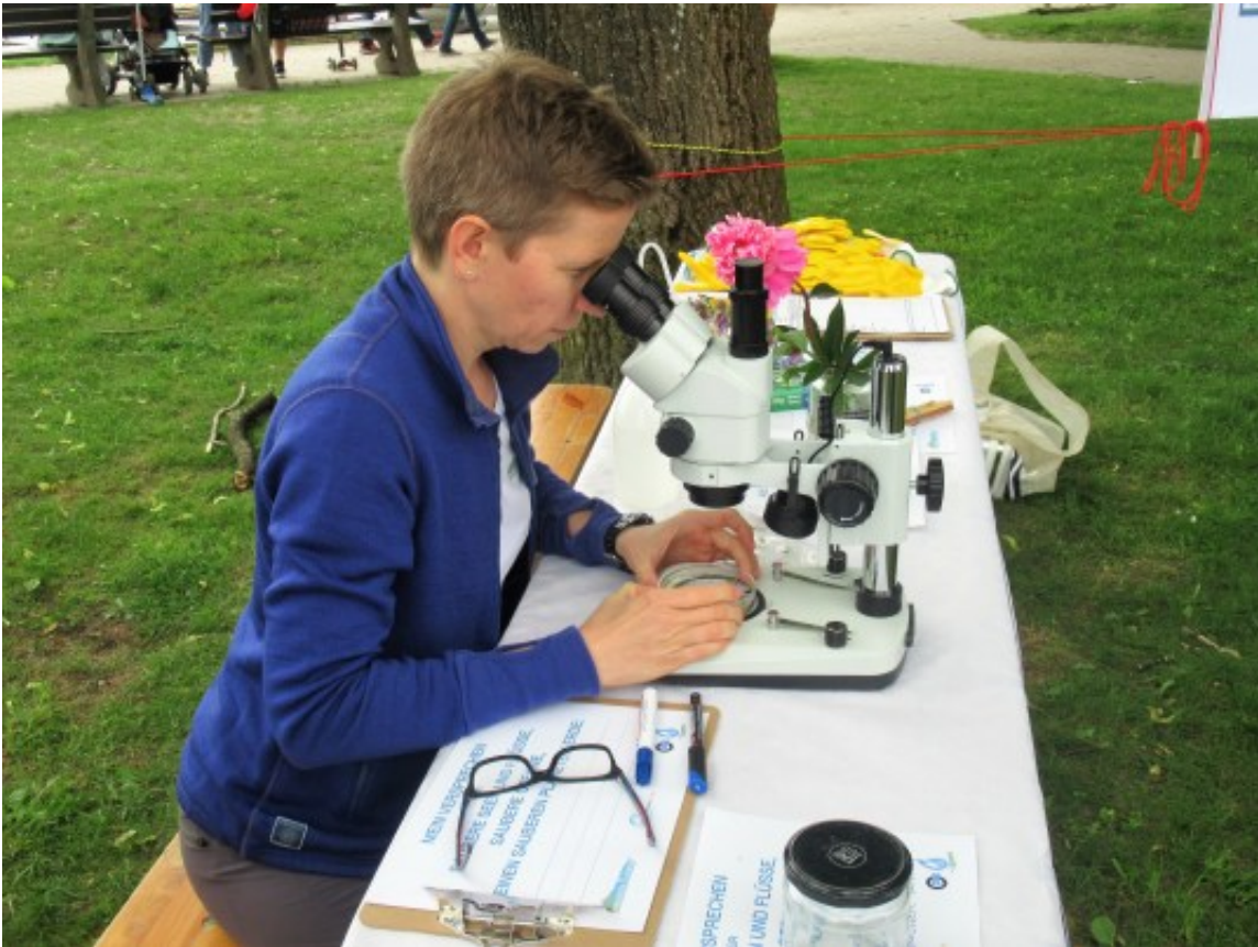
Wasserprobe unterm Mikroskop