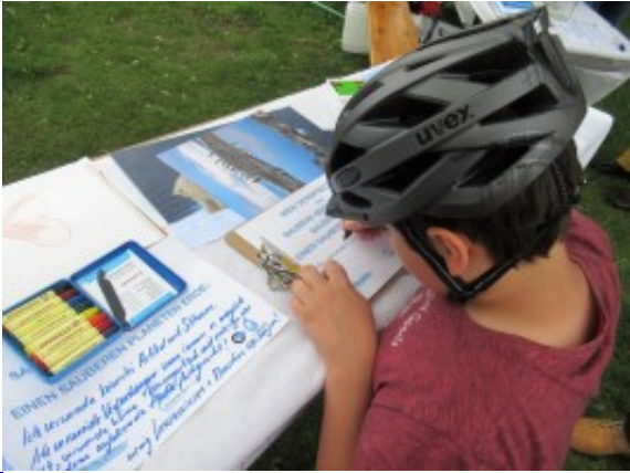
junger Besucher verspricht umweltfreundlich zu handeln