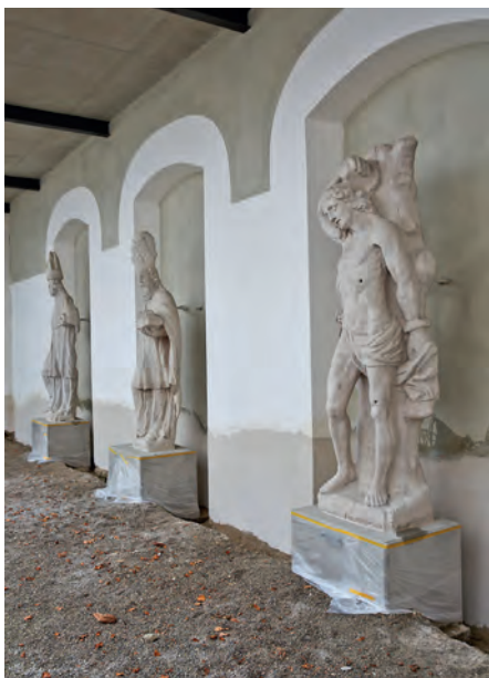
Hl. Augustinus, Papst Sixtus, Hl. Sebastian