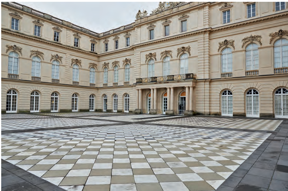
Prächtig gestalteter Schlosshof (LAMA/BSV)