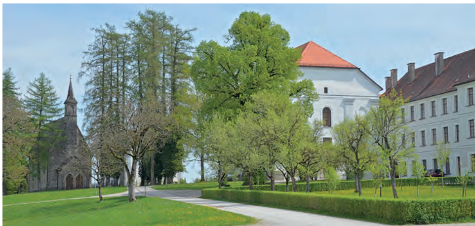
Marienkirche, Inselndom und Augustiner Chorherrenstift (CL/BSV)

Über eine Treppe kommen wir zu der alten Marienkirche aus Tuffstein, einst die Pfarrkirche für die Leute aus Breitbrunn, die jeden Sonntag bei jedem Wetter mit dem Ruderboot über den See hierher kommen mussten. Besonders wertvoll sind die Kassettendecke mit Szenen aus dem Marienleben und der frühbarocke Altar.