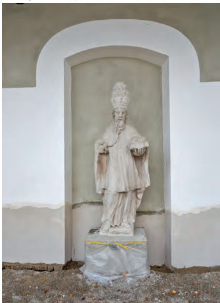
Papst Sixtus

Neben der Pforte weist uns ein Schild darauf hin, dass von der Herreninsel aus das Christentum bis nach Slowenien gelangte, weshalb die dort ansässige slawische Bevölkerung noch heute in der Mehrheit dem katholischen Glauben anhängt. Nun sollten wir den ersten Höhepunkt auf der Insel besichtigen, das ehemalige Augustiner-Chorherren Stift.