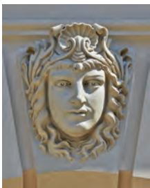
Dekor an der Schlosswand

Pazifikküste Nordamerikas stammen und sich durch ihre Höhe von bis zu fünfzig Metern, weiche Nadeln und kleine Zapfen von Fichte oder Tanne unterscheiden.