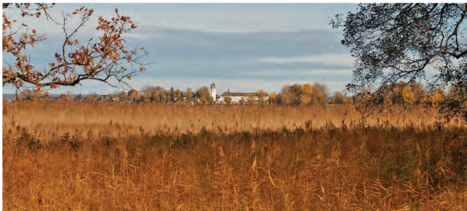
Blick über den Schilfgürtel zur Fraueninsel