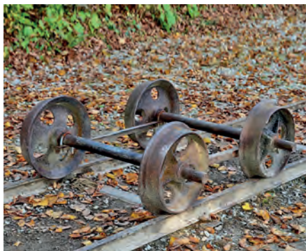
Erinnerung an die Materialbahn (JZ/BSV)

Am Latonabrunnen und den Blumenrabatten vorbei gelangen wir zu einem schattigen Spazierweg, der uns in etwa zwanzig Minuten zum Kloster, der daneben liegenden Schlosswirtschaft und zum Dampfersteg zurückbringt.