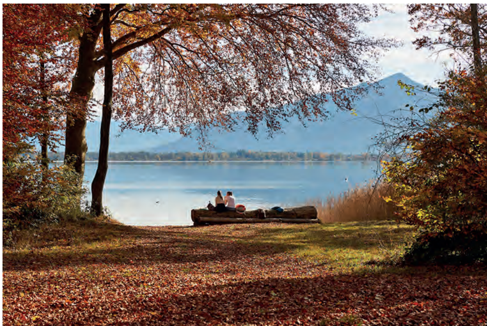
Rast an der Pauls Ruh

Auf der Südseite der Insel geht es nun etwa zwanzig Meter über dem Wasserspiegel des Sees durch einen prächtigen Buchenwald. Dem aufmerksamen Wanderer werden die auf der linken Seite wachsenden mächtigen Nadelbäume mit einer stark gefurchten Rinde auffallen. Es sind Douglasien, die von der