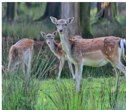
Damwild im Hirschgatter (JZ/BSV)