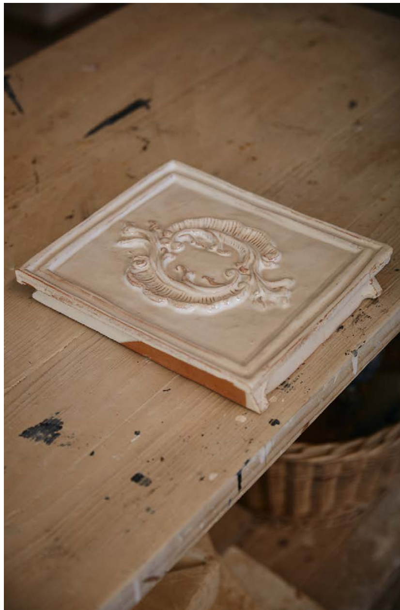
Bei einem –faszinierenden– Blick in die Töpferwerkstatt wird das Betrachter-Auge schnell auf Details gelenkt – zum Beispiel zu einer Kachelofen-Kachel.